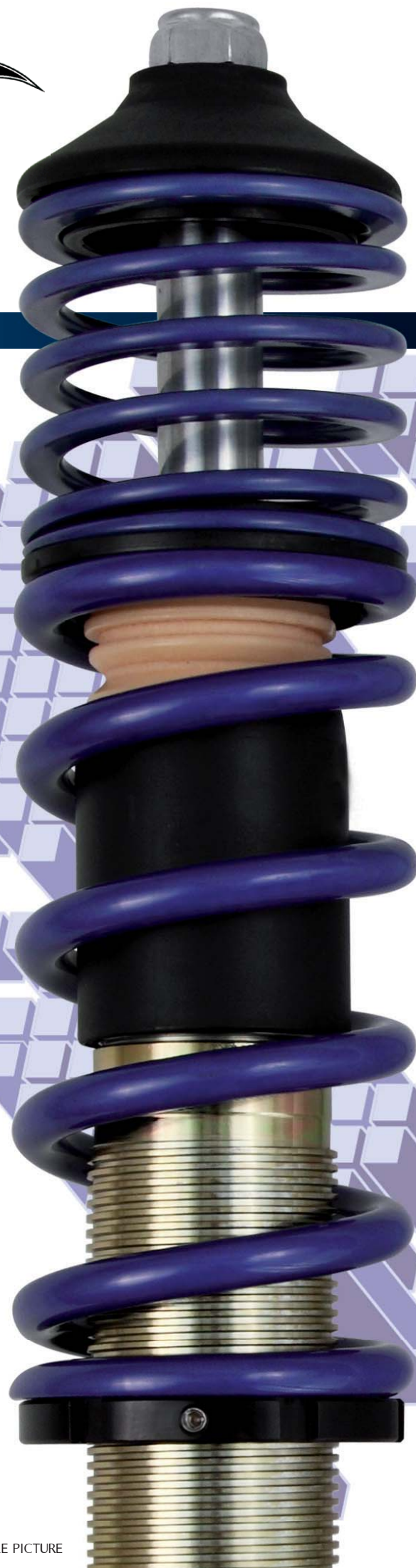
ABBILDUNG BEISPIELHAFT / SAMPLE PICTURE